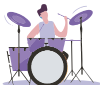
Fertigstellung & Präsentation