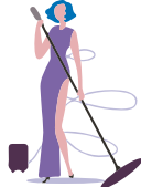
Gesangstraining & Vertonung